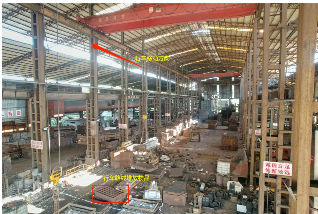
（图2）行车路线堆放物品